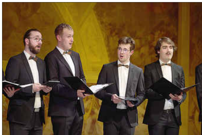
ffortissibros im Mecklenburgischen Staatstheater, April 2024

Erste Eindrücke davon gibt es bei Auftritten am 27. Februar in der Dorfkirche Finkenthal und am 1. März in der Stadtkirche Lud-