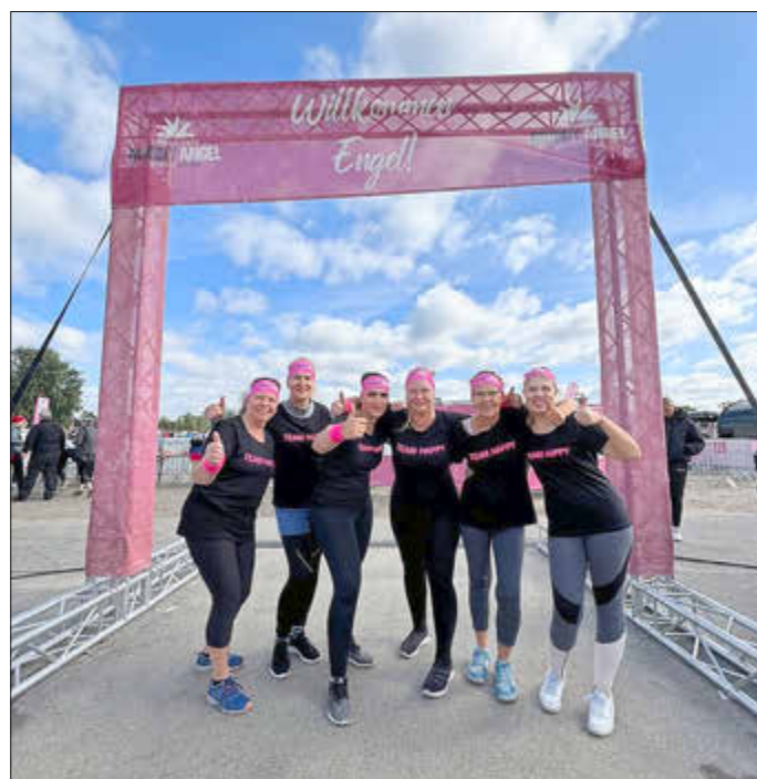
Das Team der Tagespflege CampHus setzt auf Zusammenhalt – auch bei gemeinsamen Ausflügen wie hier als „Team Happy“ beim „Muddy Angel Run“ im vergangenen Sommer in Hamburg.

Kraft und Freude in der Geselligkeit. Neben der Tagespflege CampHus betreibt die Volkssolidarität SWM mit der Tagespflege Ludwigslust Am Alten Forsthof eine weitere teilstationäre Einrichtung.