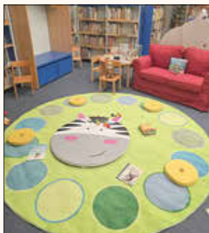
Spielteppich für Babys