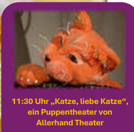
11:30 Uhr „Katze, liebe Katze“, ein Puppentheater von Allerhand Theater

Sonntag, den 09.03.25 ab 10 Uhr im ZEBEF