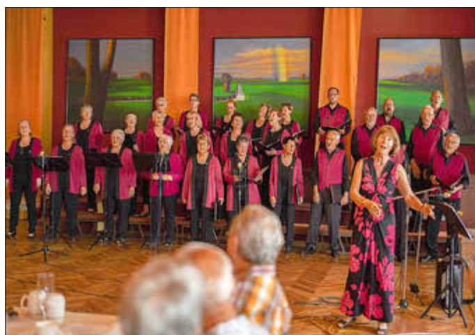
Gemischter Chor Rastow aus Rastow