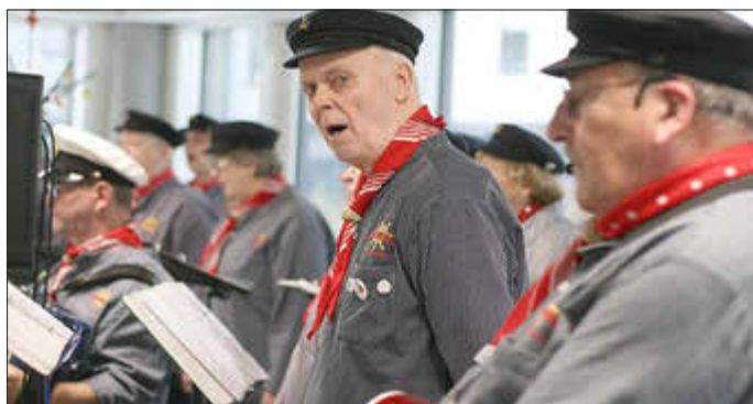
„Achtern Möhlendieck“ - der Shantychor aus Hagenow tritt bei der Frauentagsfeier im CampHus am 8. März 2025 auf.

08.03.2025 | 14:30 - 17:30 Uhr | Bistro „Kümmken“