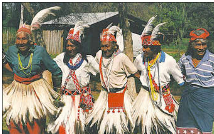
Maka Tänzer: Tanz Sehe Ju-Unipji (dt.: Wir leben auf unserem Land), Paraguay