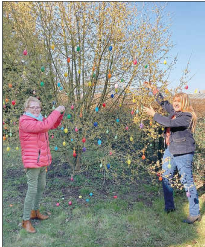
Die Kornelkirsche Cornus mas am Natureum wird geschmückt.

Aber nicht nur Vögel legen Eier. Dies wird anschaulich dargestellt durch eine absolute Rarität aus dem Reich der Insekten, dem Frankfurter Ringelspinner. Eigelege anderer Tiere und vieles mehr sind in mehreren Vitrinen zu se-