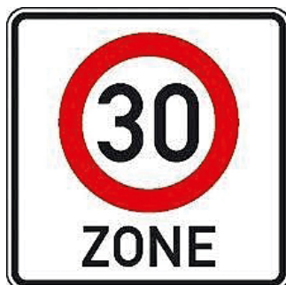
Zeichn 274.1 Beginn der Tempo 30-Zone