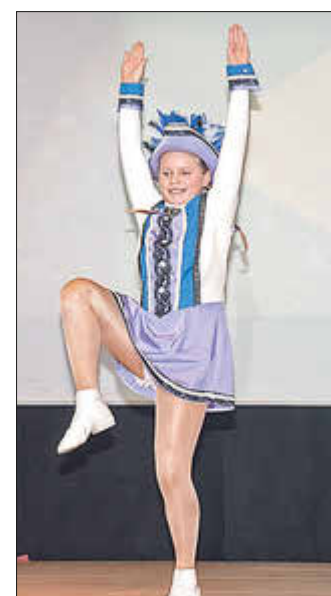
Text und Bilder: Celine-Chantal Elster