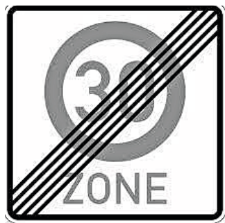
Zeichen 274.2 Ende der Tempo 30-Zone