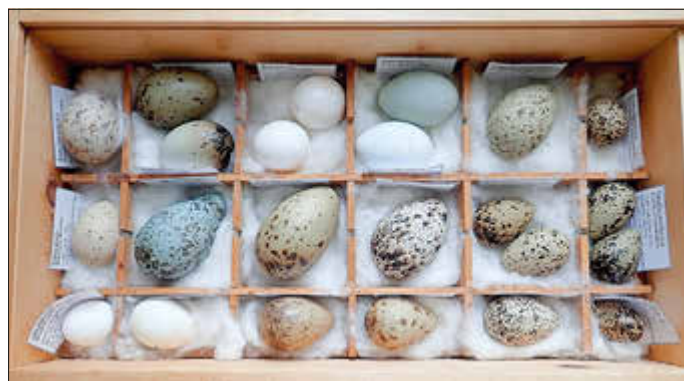
Blick in die Eiersammlung von Dr. Horst Zimmermann

Der Eintritt für die Ostertage beläuft sich für Erwachsene auf 4 € und für Kinder auf 2 €, für den Rest des Jahres, dann allerdings ohne die Eier-Raritäten, 3 bzw. 1 €.