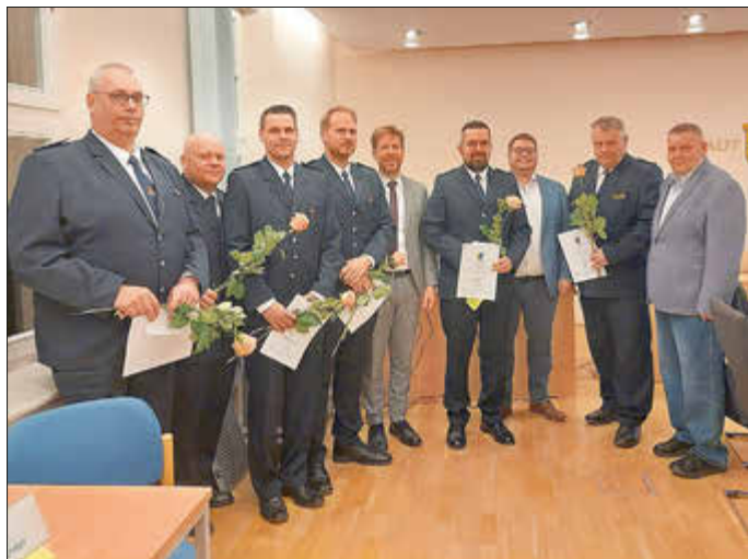
Ernennung der Ehrenbeamten

Wir danken allen Feuerwehrleuten für Ihren unermüdlichen Einsatz.