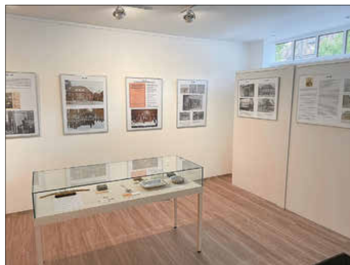
Blick in die aktuelle Ausstellung

Vereinbaren Sie dazu telefonisch unter 0173/2474039 einen Termin und besuchen Sie uns im Heimatstübchen in der Schlossstraße 46.