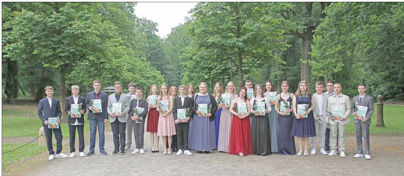
2026 findet die festliche Feierstunde zur Jugendweihe für Ludwigslusterinnen und Ludwigsluster am 6. Juni statt.