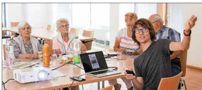
Der „Digitale Engel“ macht am 20. März 2025 Station im CampHus Ludwigslust.

Der Experte vom „Digitalen Engel“ gehe außerdem auf Fragen zu aktuellen Themen aus der digitalen Welt ein. Eine Anmeldung zu dieser Veranstaltung ist erforderlich unter campus@vs-swm.de oder unter der Telefonnummer 0 38 74 - 66 99 030