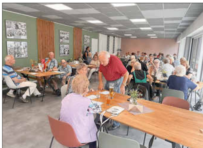
Am 3. April 2025 wird im CampHus Ludwigslust wieder Bingo gespielt.

Anmeldung telefonisch unter 038 74 - 66 99 030 oder per E-Mail unter campus@vs-swm.de