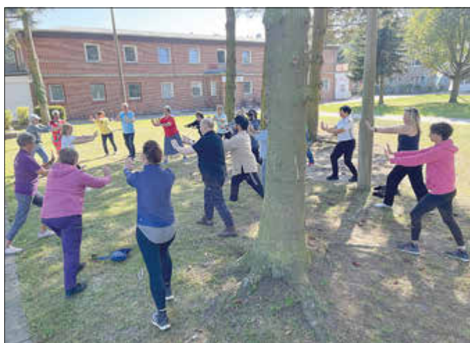
Dehnung und Entspannung

stand älterer Menschen. Die Teilnehmer werden befähigt, eine Gruppe anzuleiten und Kurseinheiten im Freien selbstständig zu planen. Dabei werden praktische Übungen (meist ohne Geräte) gemeinsam erprobt. Es ist keine Lizenz notwendig, um teilzunehmen. Die acht Lerneinheiten lassen sich jedoch für eventuelle Verlängerungen von ÜL-Lizenzen anrechnen. Ein schöner Nebeneffekt. Sie benötigen weitere Informationen zu dieser Schulung? Dann melden Sie sich gerne bei Hannah Kirschnick unter: 0176/70777399. Die Anmeldung zur Ausbildung ist formlos über info@ksb-ludwigslust-parchim.de möglich.