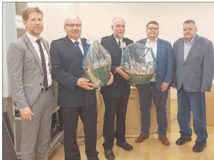
Dankeschön an die ausscheidenden Ortswehrführer