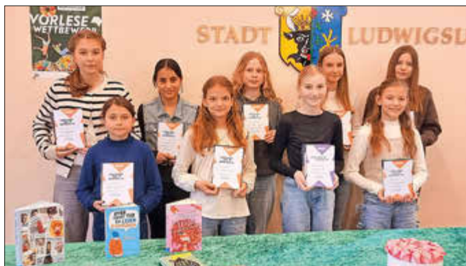
Teilnehmerinnen des Vorlesewettbewerbs