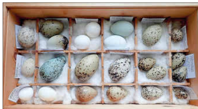
Einblick in die Sammlung des Natureums Ludwigslust