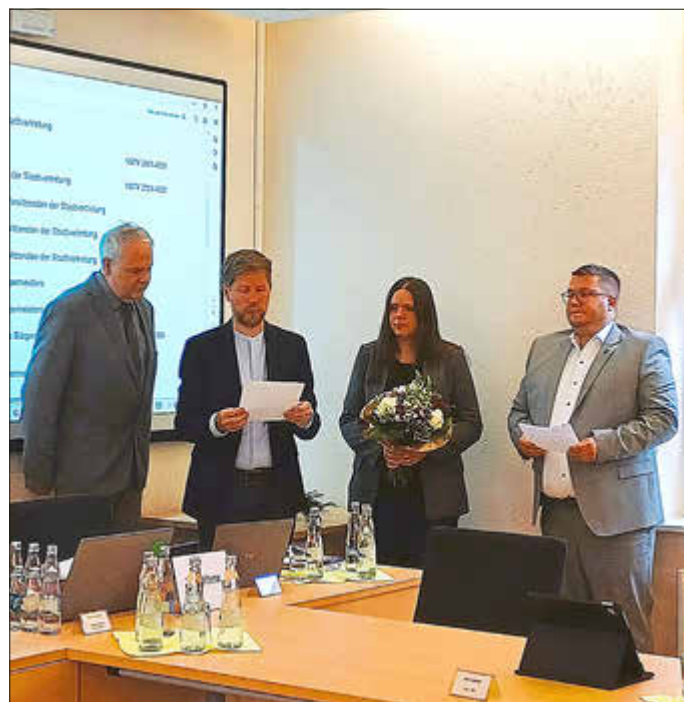
Die beiden Stellvertretenden des Bürgermeisters wurden durch Herrn Pinnow auf ihr Amt verpflichtet.

Auch die Besetzung der Ausschüsse, Mitglieder in den kommunalen Verbänden und Vertretungen in den Aufsichtsräten der kommunalen Unternehmen wurden beschlossen. Die detaillierte Besetzung finden Sie auf unserer Website.