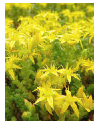
Der Scharfe Mauerpfeffer ( Sedum acre ) ist die häufigste Art der Gattung