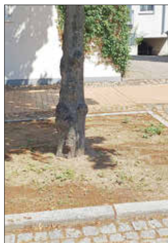
So sieht es jetzt noch aus ...

In der Clara-Zetkin-Straße 47-59 und in der Lindenstraße 46-62 haben unsere Betriebshofmitarbeiter in die umfriedeten Bereiche um die Bäume eine Blühwiesenmischung eingebracht.