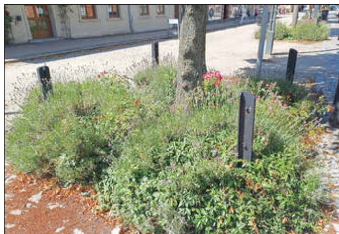
... und so oder so ähnlich soll es mal werden.

aber gerade in der ersten Zeit die Pflanzen viel Wasser benötigen, würden wir uns freuen, wenn die Bewohner dieser Straßen ab und zu etwas wässern. Vielen Dank.