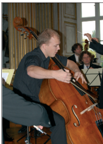
Preisträger des Jahres 2008 beim Abschlusskonzert

Vom 08. bis 15. Mai 2016 Zeit findet der Internationale Johann-Matthias-Sperger-Wettbewerb endlich wieder in Ludwigslust statt. Bereits in den Jahren 2004, 2006 und 2008 bot unsere Stadt dem Wettbewerb hervorragende Bedingungen. Viele der Wettbewerbsteilnehmer fanden während ihres Aufenthaltes in Familien unserer Stadt ein zeitlich begrenztes „zweites Zuhause“.